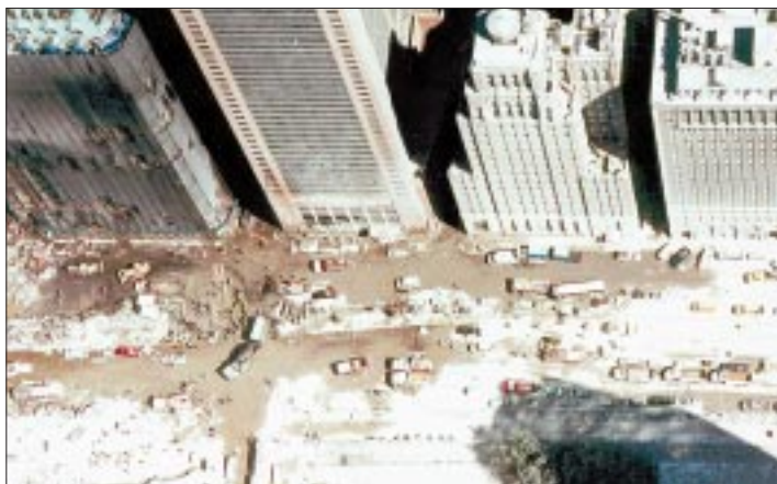
El centro de la ciudad que nunca duerme quedó devastado como pisoteado por un gigante.