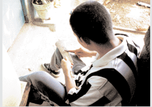
Asistir a firmar un acta al respectivo Tribunal cada cierto tiempo es una de las normas de conducta más comunes que se imponen en estos casos.

Mientras los beneficios ganados por unos no chocan con los derechos de seguridad de otros, las buenas noticias pueden seguir alegrando los días de visita en un pequeño patio carcelario. Lo que importa, lo que hace falta, es que de una vez los reiterados golpes de mazo de la ley logren limar las asperezas de mecanismos viciados, para así evitar que el cerrojo de la libertad se siga abriendo con la llave equivocada.