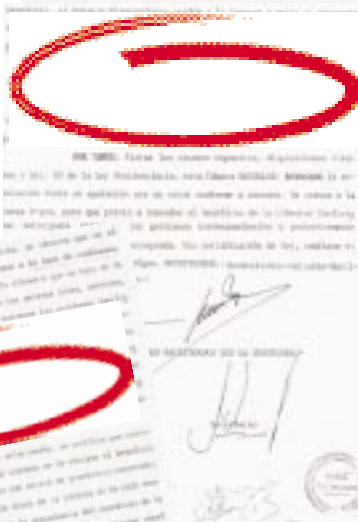
No analizar el dictamen del Consejo Criminológico fue razón suficiente para que la Cámara de la Cuarta Sección del Centro revocara la resolución judicial.

El problema es que en la iglesia no me permiten ir a los Alcohólicos Anónimos. Dicen que ahí sólo va gente vulgar, que fuma. Ya no me dejan predicar y cantar como antes. Dicen que no es bueno para mi testimonio. Aunque esté mejorando en muchas cosas, siento que me falta esa promesa, y no imagino un cambio real en mi vida, sin antes estar en paz con Él”.