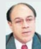
Francisco Merino Diputado del PCN