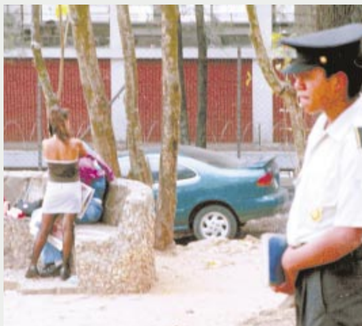
La amenaza de un asesino en serie ha hecho que la Policía incremente las medidas de seguridad en las zonas con alto índice de prostitución.

Los ataques a las prostitutas del asesino en serie en Ciudad de Guatemala ha obligado a las trabajadoras del sexo a tomar precauciones por su calidad de víctimas potenciales. La mayoría de ellas deambulan por las calles a la espera de clientes; las más valientes descubren sus cuerpos, retando a la fresca noche guatemalteca o, peor aún, al asesino en serie.