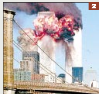
El segundo avión impacta en la otra Torres.