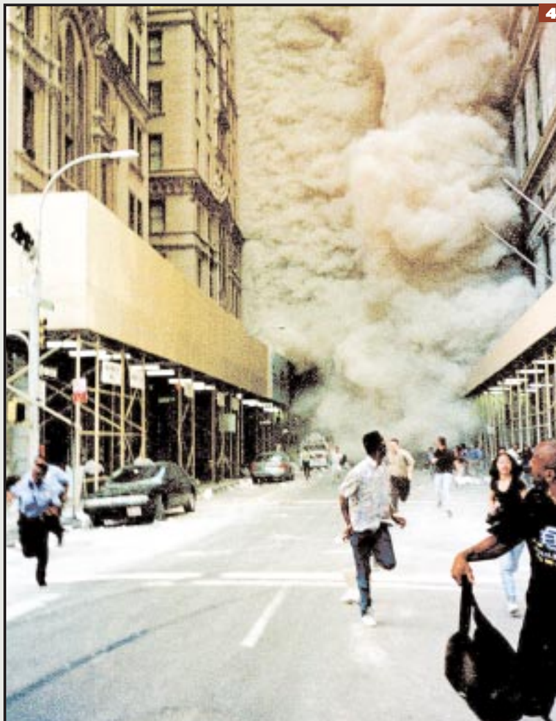
Las Torres parecieron tragarse a sí mismas.