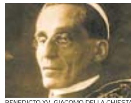
BENEDICTO XV, GIACOMO DELLA CHIESTA, REINÓ DURANTE LA I GUERRA MUNDIAL.