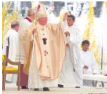
Su Santidad da la bendición a la multitud, que con mucha emotividad lo aclamó.