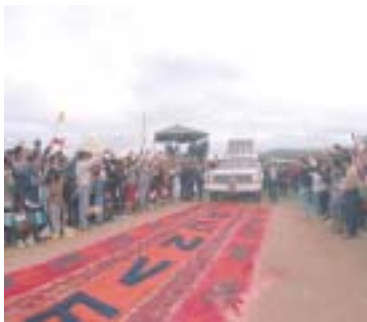
Los feligreses le dieron la bienvenida por medio de mensajes en alfombras alegóricas.