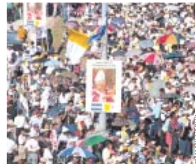
Los capitalinos se volcaron a mostrar su afecto al Santo Padre en todas las maneras posibles.